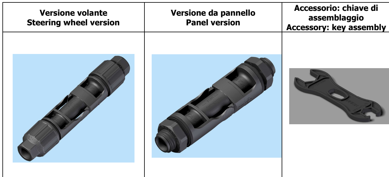
TABLE 1 (codes) / Tabella 1 (codifica)