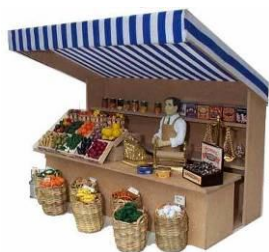
Sagre Mercati Fiere