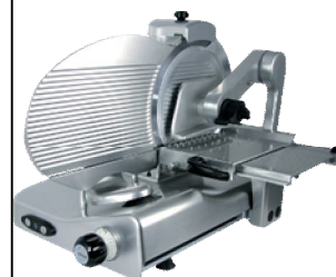
CUCINE PROFESSIONALI / BAR