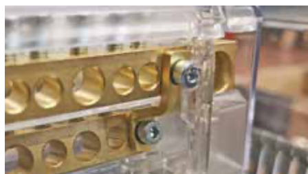
Espansione neutro mediante ponticello Neutral expansion by means of a jumper