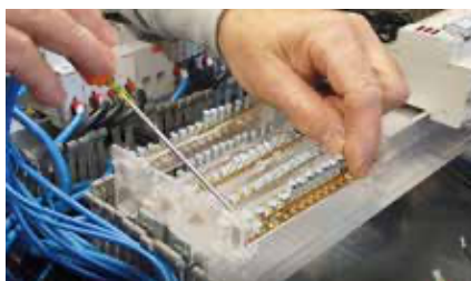
Sistema di sgancio barretta dal supporto Decoupling bar system from base