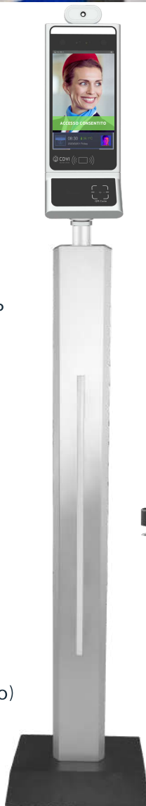
C20 Base da tavolo Cablata